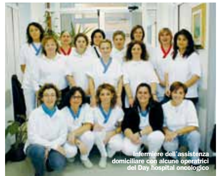
Infermiere dell'assistenza domiciliare con alcune operatrici del Day hospital oncologico